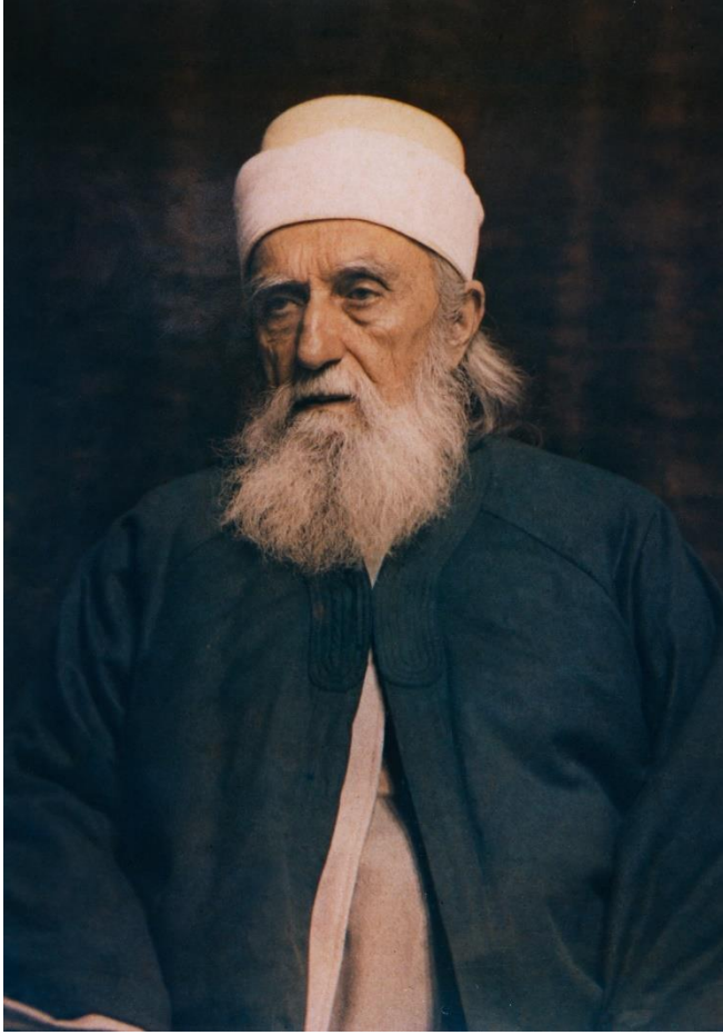
Hız. Abdlbaha'nın bu renkli fotođrafı Ekim 1911'de Paris'te çekilmiřtir.