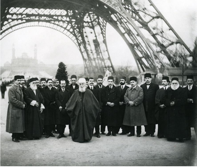
Hz. Abdülbaha'nın bir grup dostla birlikte olan bu fotoğrafı Ocak 1913'te Paris'te Eyfel Kulesinde çekilmiştir.